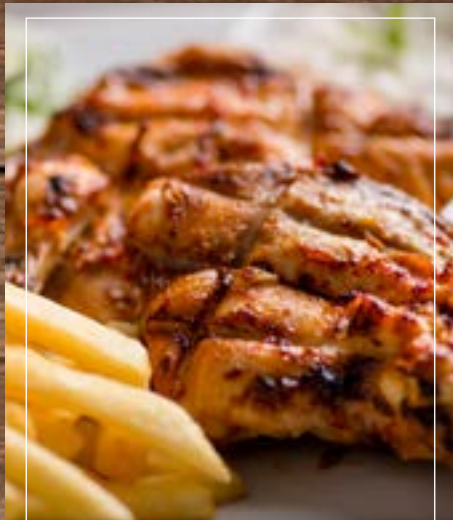
دجاج على الفحم Grilled Chicken BD 3.80