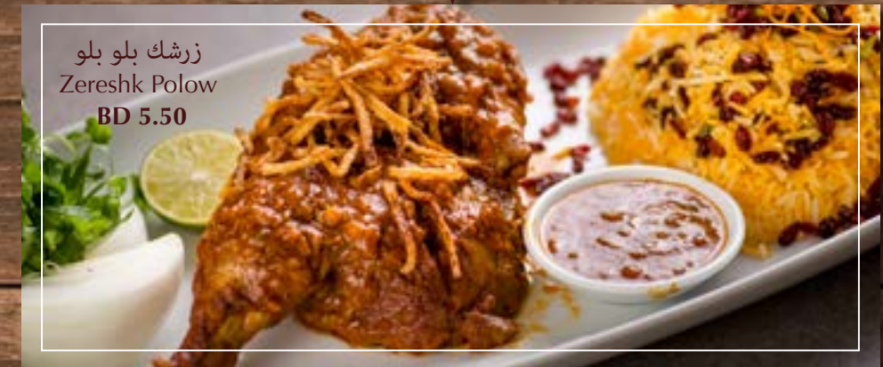
زرشك بلو Zereshk Polow BD 5.50

Jujeh Kebab Kofta جوجة كباب كفتة Minced chicken kebab served with bread دجاج مفروم مع البصل و التوابل يقدم مع الخبز