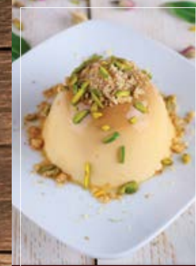
كريم كراميل Cream Caramel BD 2.60