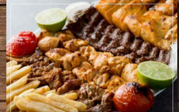
مشاوي فارسية مشكلة Persian Special Mixed Grill BD 22.00