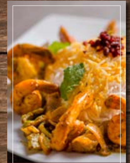
ميكو إي كرفسي Maygu-E Karafs BD 6.20