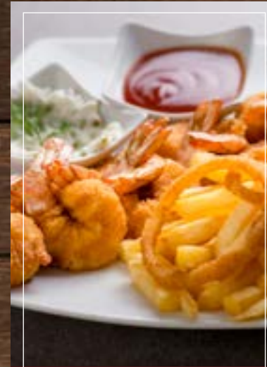
روبيان بانیه Shrimps Bani BD 5.70