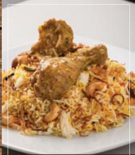
برياني دجاج Chicken Biryani BD 3.90