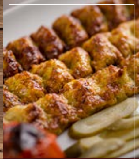
جوجة كباب كفتة Jujeh Kebab Kofta BD 5.20