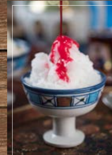
فالودة Falooda BD 2.60