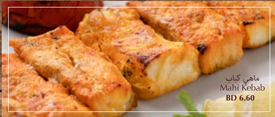
ماهي كباب Mahi Kebab BD 6.60

Shrimps Biryani برياني روبيان Biryani served with rice برياني الروبيان يقدم مع الأرز