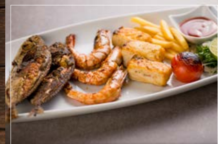
مشويات بحرية مشكلة Seafood Mix Grill BD 9.90

Grilled hammour, shrimps and fried saafie fish served with bread هامور مشوي، روبيان مشوي، سمك صافي مقلي يقدم مع الخبز