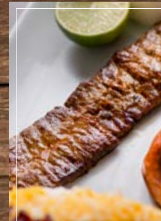
كباب برك Kebab Barg BD 5.50