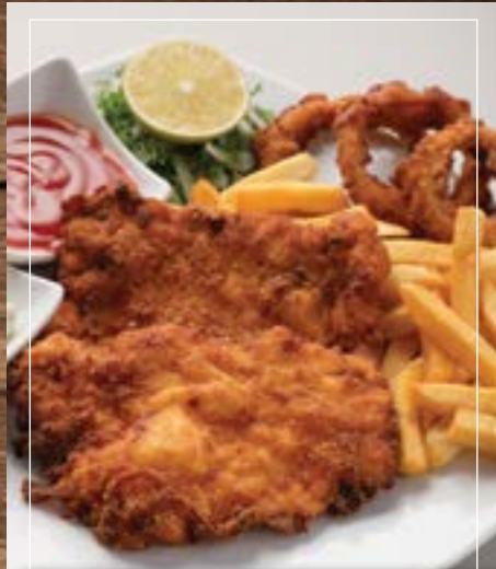
دجاج شنزل Chicken Shenzel BD 3.60