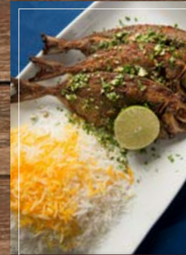
ماهي أصفهاني Mahi Isfahani BD 4.60