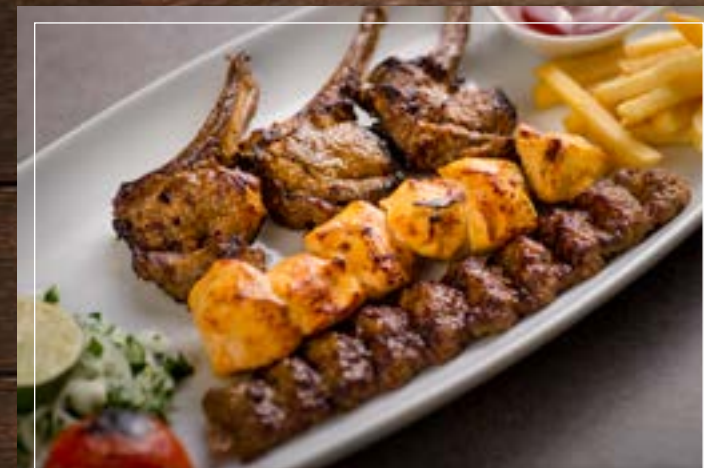
مشويات إصفهاني مشكلة Isfahani Mixed Grill BD 6.60