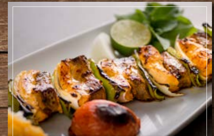
بختياري كباب Bakhteari Kebab BD 6.60