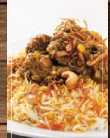
برياني لحم Lamb Biryani BD 4.20