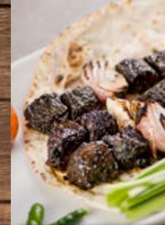
تكة فارسية Persian Tikka BD 4.90