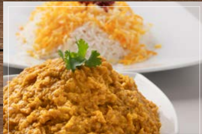
البدال الفارسي Persian Dal BD 2.60