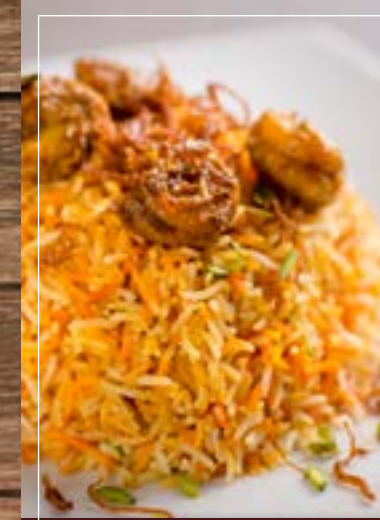
برياني روبيان Shrimp Biryani BD 4.60