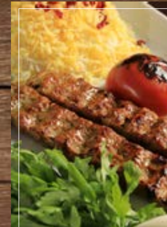
جلو كباب Chelo Kebab BD 4.90