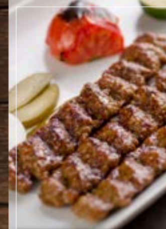
كباب أصفهاني Kebab Isfahani BD 5.20

biryani served with rice برياني للحم الخروف يقدم مع الارز