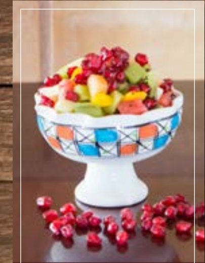
سلطة فواكه Fruit Salad BD 2.20