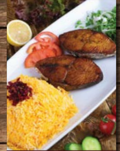
ماهي سرخ شده Mahi Sorkh Shodeh BD 4.80