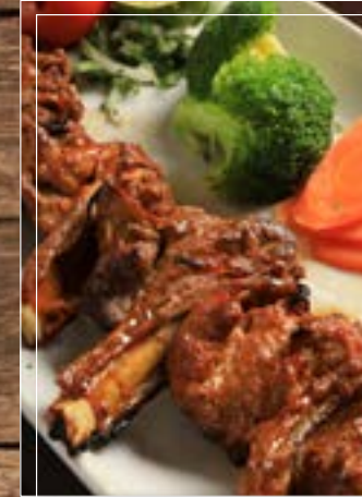
شيشليك Shishlek BD 6.60