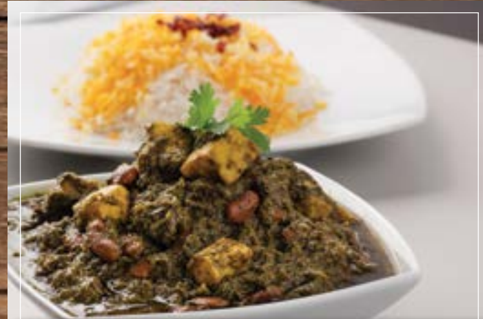
قورمه سبزي بالجبنه Qormeh Sabzi Paneer BD 3.70