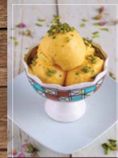
بستي زعفران Saffron Bastani BD 3.10