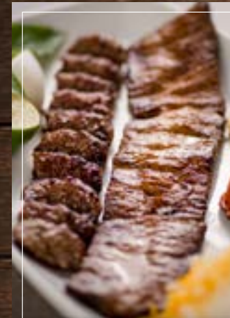
جلو كباب سلطاني Chelo Kebab Sultani BD 6.60