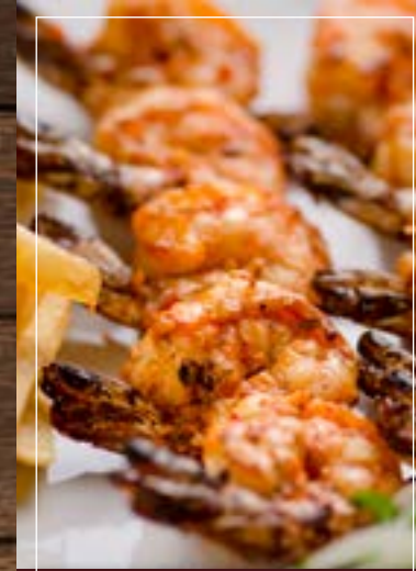
ميكو كباي Grilled Shrimps BD 5.70