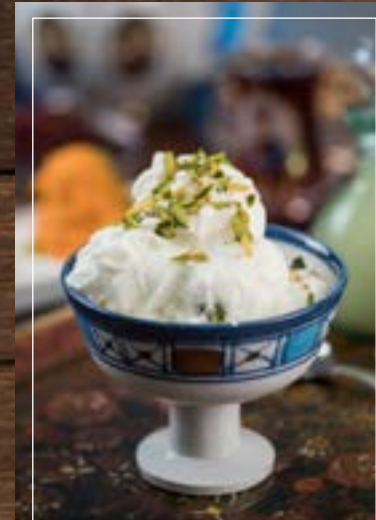
بستي فانيليا Vanilla Bastani BD 2.60