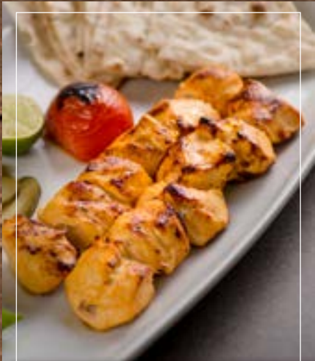
جوجة كباب أصفهاني Isfahani Jujeh Kebab BD 4.90